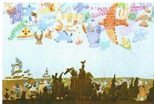
Ilustración del libro Los siete domingos

El Premio Lazarillo de Ilustración está dotado con 1.000.000 de pesetas (aproximadamente unos 6.000 euros) y cada accésit con 220.000 (aproximadamente 1.300 euros).